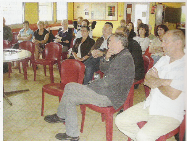
Au premier plan les personnes Greffées